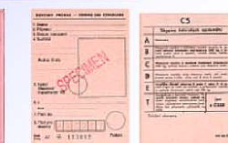
ŘP vydány v období: 1992-1993