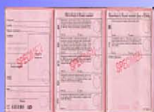
ŘP vydány v období: 1.7.1964-1986