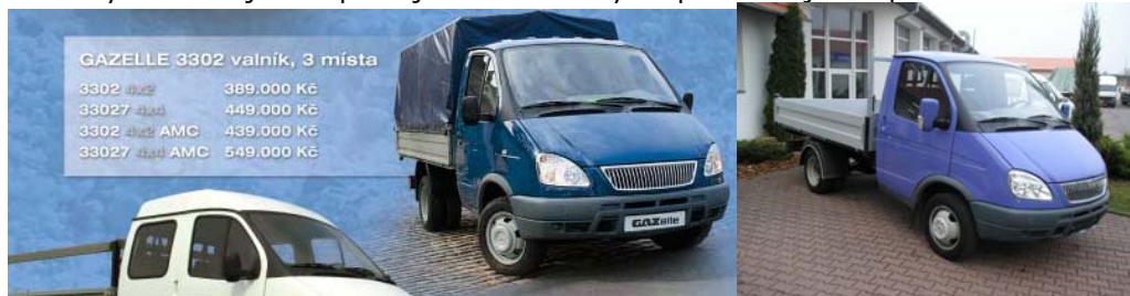
GAZELLE 3302 valník, 3 místa

Jedná se o třístranný sklápěč GAZelle s nákladovou plochou 3100mmx2000mm, který bude využíván zejména při zajišťování údržby a oprav veřejného prostranství.