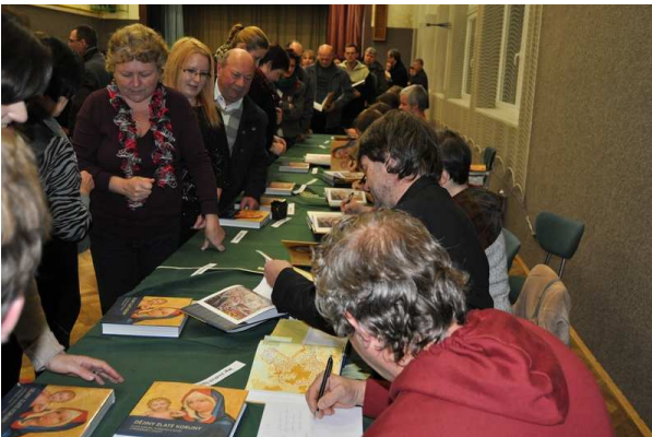
Autogramiáda 21.12.2013 (ostatní fotografie na www.zlatakoruna.cz )

Poprvé je uceleně podán její vývoj nejen po dobu trvání kláštera, ale i po jeho zrušení včetně počátků zdejšího průmyslového podnikání, obecní samosprávy, školství, spolku i událostí po vzniku republiky. Součástí obce jsou také vsi Plešovice a Rájov, jejichž dějiny jsou sepsány v knize poprvé. Kniha souhrnně pojednává také o zdejších historických a uměleckých památkách. Je vybavena velkým množstvím historických i současných fotografií, které dosud z velké většiny nebyly publikovány, je doplněna mnoha původními kresbami a mapami, podává rámcově přehled i o zdejším přírodním prostředí. Svoji šíři záběru nabízí čtenáři komplexní představu o Zlaté Koruně, jejích dějinách i pamětihodnostech.