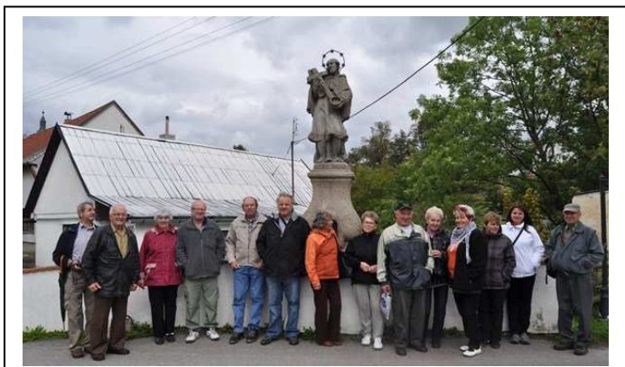
Část účastníků na kamenném můstku v Netolicích

U příležitosti 750.výročí od založení Zlaté Koruny pořádala Obec Zlatá Koruna autobusový výlet po bývalých državách svého kláštera, kterého se účastnilo 57 našich spoluobčanů. Účastníci tohoto výletu navštívili Vojenský újezdni prostor Boletice, kostel sv. Mikuláše z 2. poloviny 12. století a kostel sv. Martina v Polné na Šumavě. Dále kostel svatě Máří Magdalény a muzeum Schwarzenberského plavebního kanálu ve Chvalšínách, Obec Ktiš a město Netolice, městské muzeum JUDr. Otakara Kudrny a Archeopark. Navštívili tak značnou část území, které bylo v držení kláštera Zlatá Koruna v jeho největším rozkvětu. Ostatní fotografie z výletu naleznete na www.zlatakoruna.cz