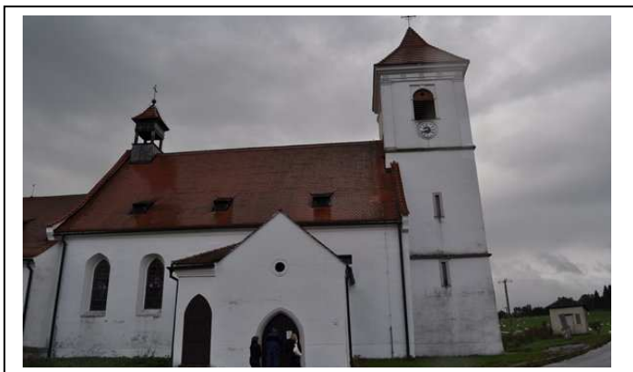
Kostel sv. Martina v Polné na Šumavě