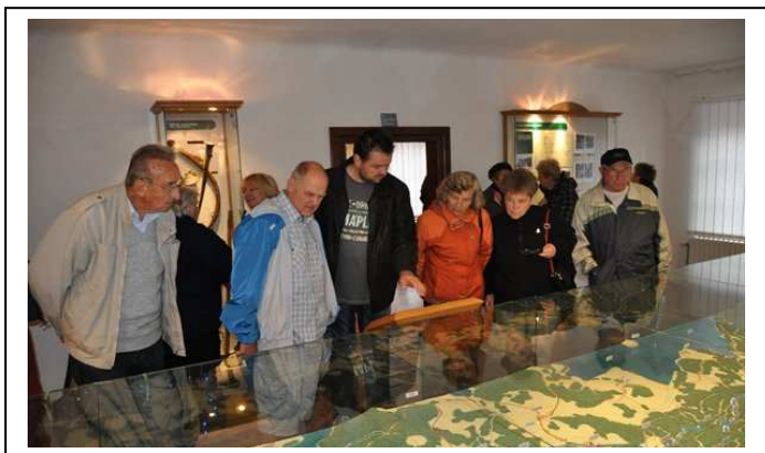
Prohlídka muzea Schwarzenberského plavebního kanálu ve Chvalšínách