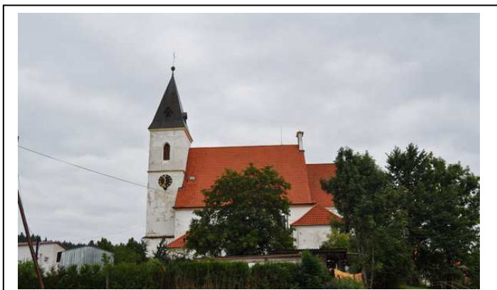
Kostel sv. Bartoloměje ve Ktiši