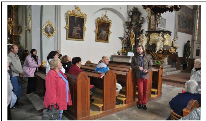
Interiér kostela svatě Máří Magdalény