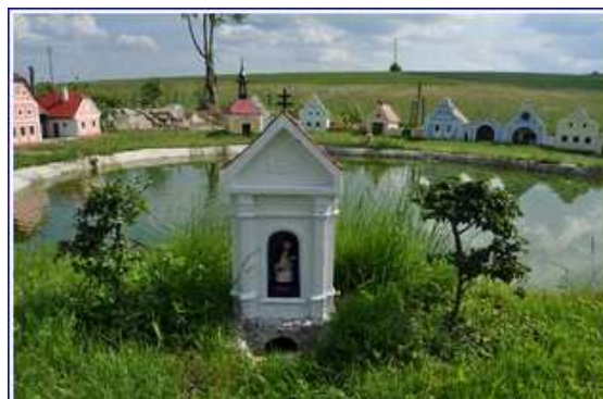
Snímek : mini vesnička Jirky Bauera v Plešovicích