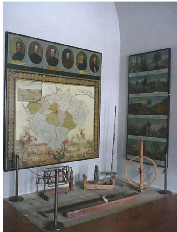
FOTO: klášterní škola s praktickými pomůckami

(2 dospělí + max. 3 děti do 18 let): 130 Kč.